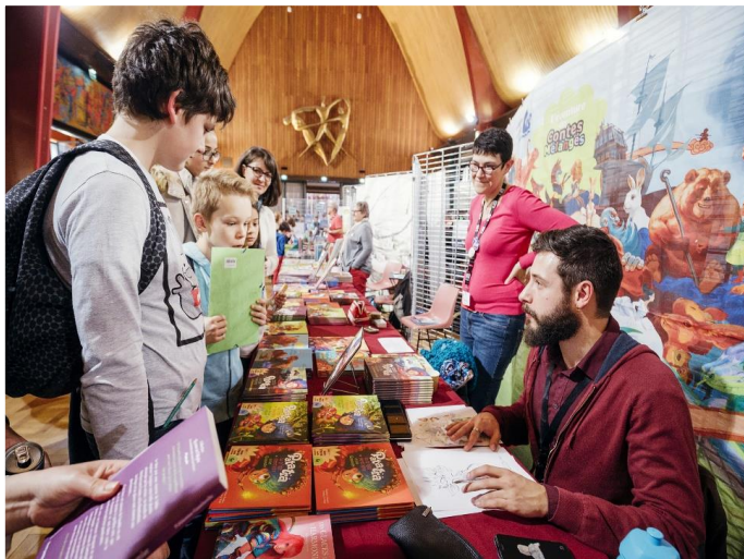
Dédicace au Festival de Rouen Normandie du livre Jeunesse, 2017